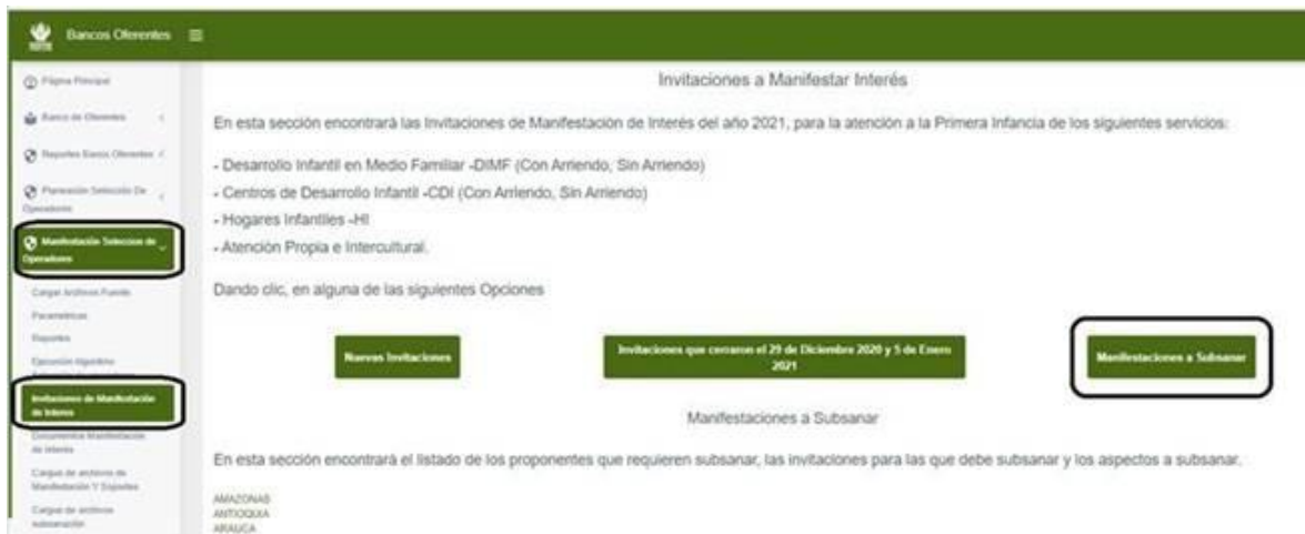
Imagen- del archivo donde se informa al Oferente que debe subsanar.

La subsanación se encuentra publicada en la carpeta “SIN IDENTIFICAR”.